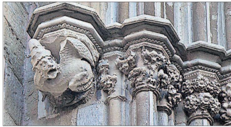
Maqueta virtual de la Seu realitzada per Bataller i un dels fotogrames