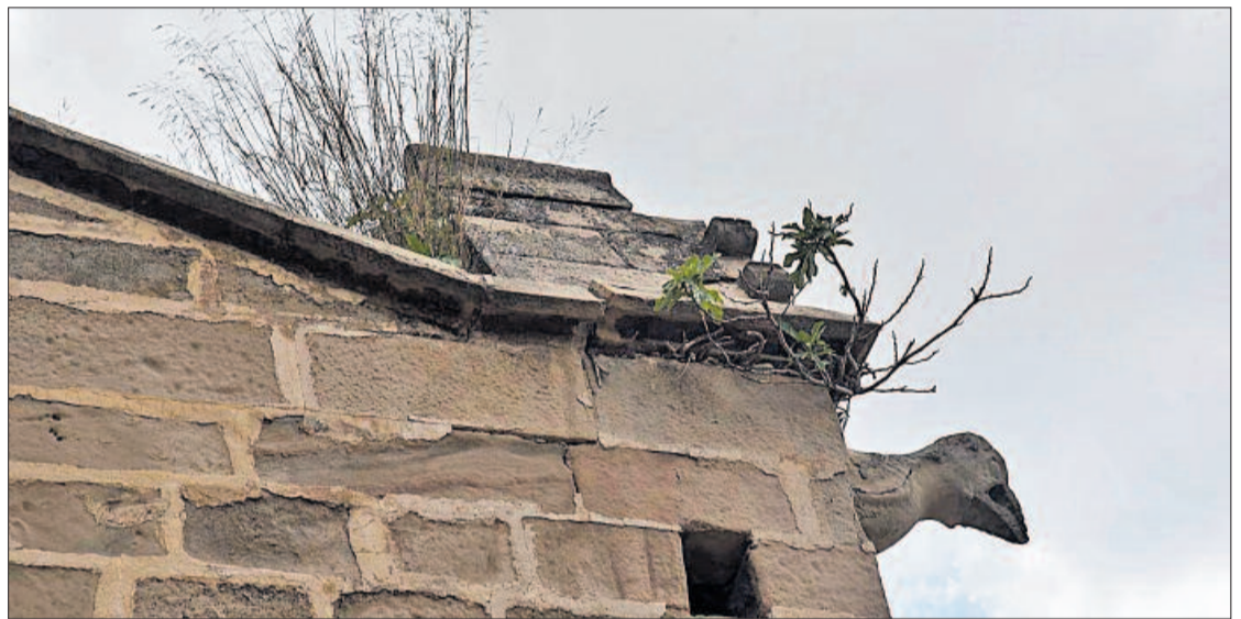
Detall de la gàrgola de l'arc boterell envoltada de vegetació i amb l'ornamentació molt deteriorada