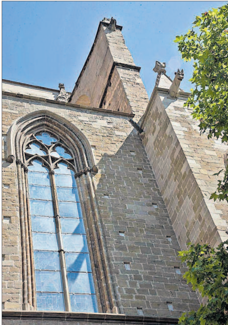
El contrafort i el pany de paret i vitrall restaurats en el darrer conveni