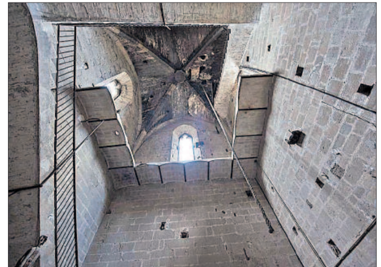
Interior del campanar, tancat al públic fins que es pugui restaurar

Abans, per donar per acabades les obres de més envergadura, encara falten les façanes i vitralls de la nau principal; a la façana nord, algun arc boterell, i el campanar sencer, d'on també es deprenen pedres. «S'ha de fer d'una sola tacades perquè si es munta la bastida s'ha d'aprofitar. Poder-lo visitar seria un potencial immens».