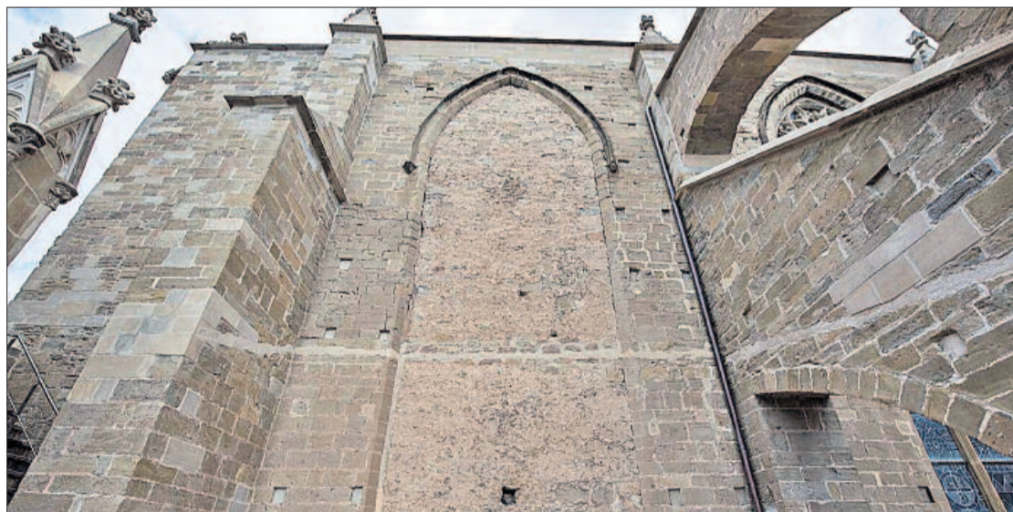
La finestra cega que, amb el reforç executat al temple l'any 2004, es podria obrir sense perill