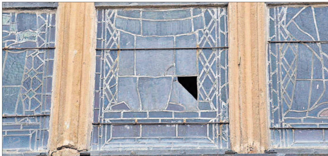
Un exemple del mal estat d'un dels vitralls que hi ha a la nau principal de la basílica manresana