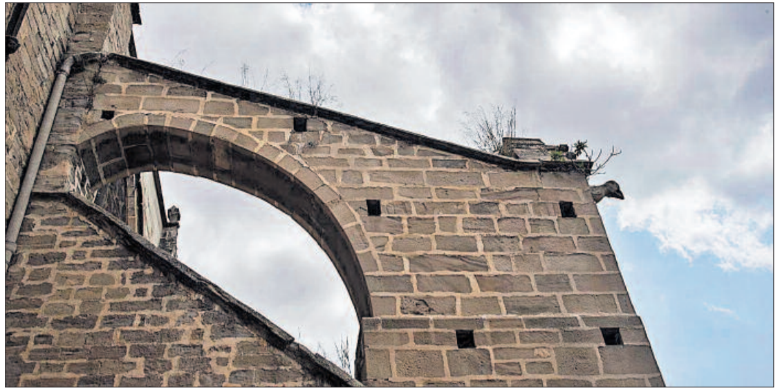
L'arc boterell que es restaurarà amb els diners del conveni d'aquest 2019, previst de cara al setembre

Si el conveni del 2019 arriba sencer i a temps, es restaurarà un dels dos arc boterells de la façana sud que encara no ho estan. Fonts del bisbat han assegurat que ells ja tenen la seva part reservada des de principi d'any i confien al cent per cent que les altres tres parts compliran, però que els tràmits administratius no sempre són tan ràpids com es voldria, que és el que va passar el 2017, apunten.