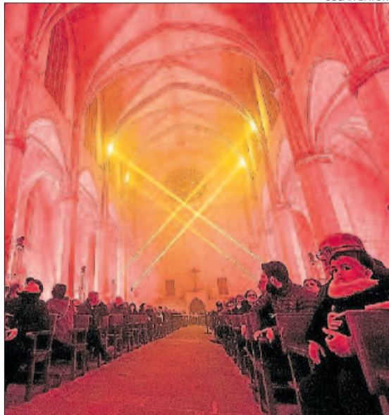
Efectes lumínics del muntatge