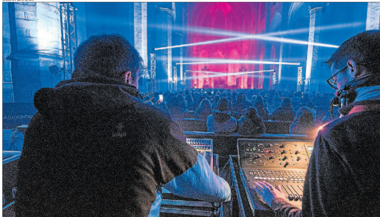
Responsables de l'espectacle coordinant el so i els llums