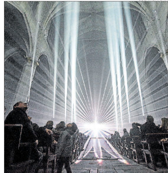
L'interior de la basílica canviada de color