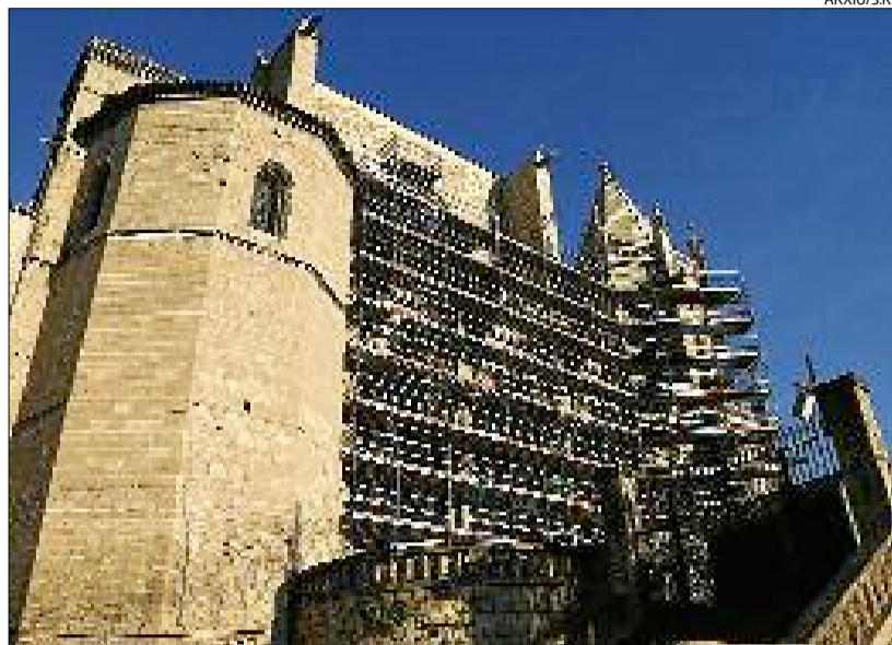
La banda de la Reforma amb la capella del Santíssim en primer terme

Guerrero ressalta que, si bé les obres estan supeditades a l'entreteniment que exigeix cada element, també hi té un