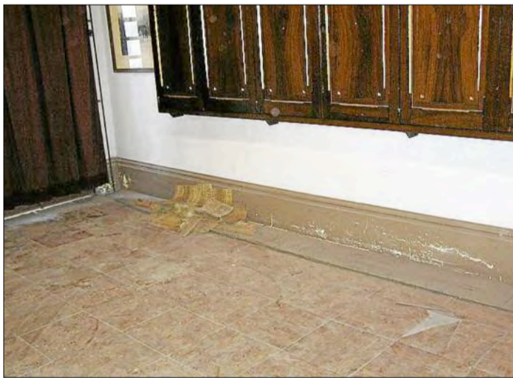
Terra descrostat i cortinatge malmès, sota l'armari on hi ha el frontal

La veu del Bisbat de Vic a la Seu és el canonge Josep Maria Gasol, qui assegura que, «tan bon punt s'acabin les obres de la façana, el propòsit és reobrir el museu», afegint que «no hi ha cap altra raó que expliqui el confinament del frontal. Gasol també confia que la millora de la situació econòmica permeti afrontar el trasllat de la peça a unes noves dependències del temple. No obstant això, l'historiador comenta que «no puc