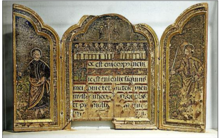
La sacra colonial on es pot veure el mal estat del text al cos central