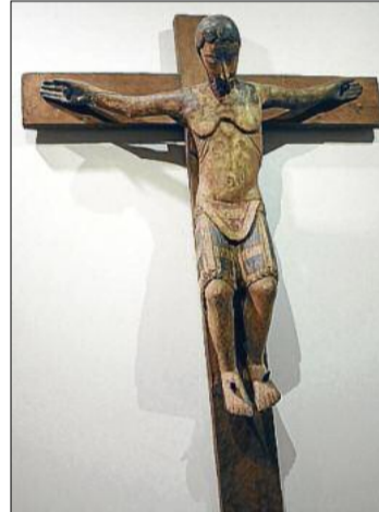
El Crist de fusta del segle XII